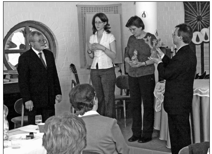
A bajor testvérgyülekezettel kialakult kapcsolat 10. évfordulóját együtt ünnepeltük a hamelburgi csoport tagjaival.