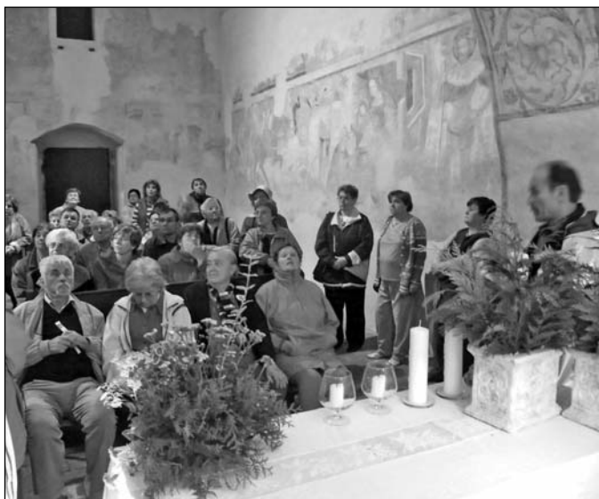
Gyülekezeti kirándulás az Őrségben – Október 10.

Október 31. Közös reformációi ünnepség a református gyülekezettel