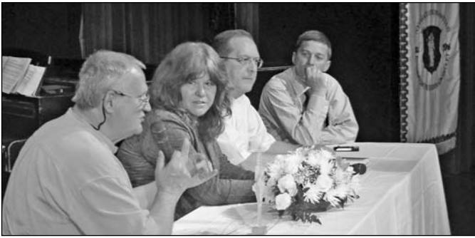
A misszió nap vendégei