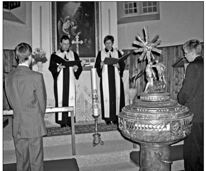
Húsvét hajnali istentisztelet szeretetvendégséggel – Április 12.