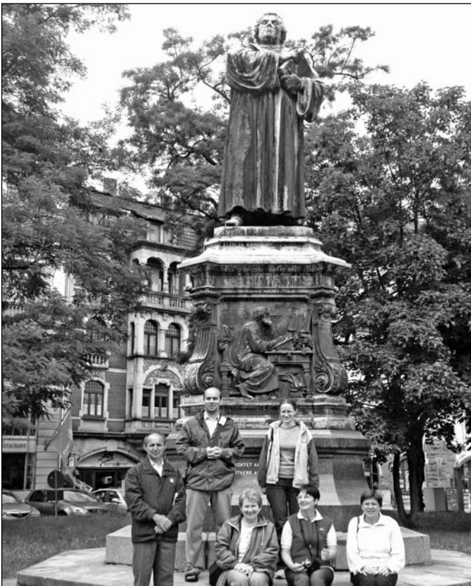
Testvérgyülekezeti látogatás Hammelburgban, a Luther emlékműnél – Június 19-23.