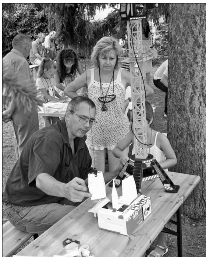
A veszprémi gyülekezet napja a dörögdi fesztiválon – Augusztus 7.