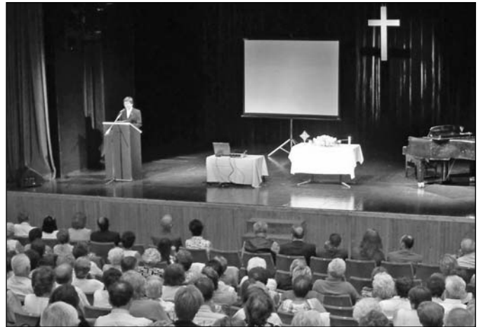
Egyházkerületi misszió nap gyülekezetünkben – Május 23.

Június 12. Tanévzáró mise a Szilágyi iskolában