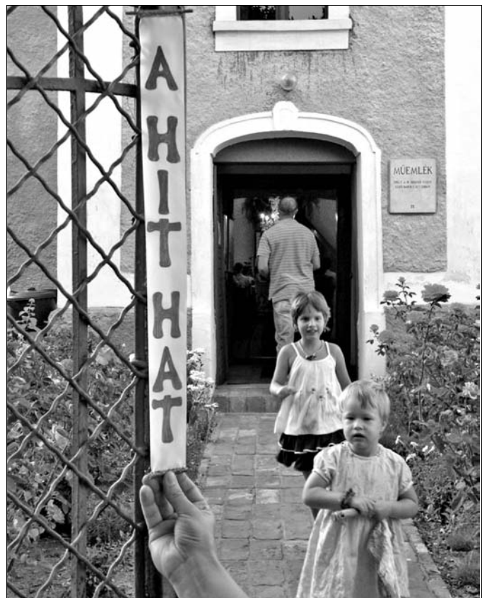
A veszprémi gyülekezet napja a dörögdi fesztiválon

Isten áldása legyen minden adventi készülődésen és karácsonyi ünneplésen! Ő adja meg nekünk, hogy karácsonyunk lelki megújulást, hitbéli megerősödést hozzon számunkra és így közösségünket is gyarapítsa, növelje!