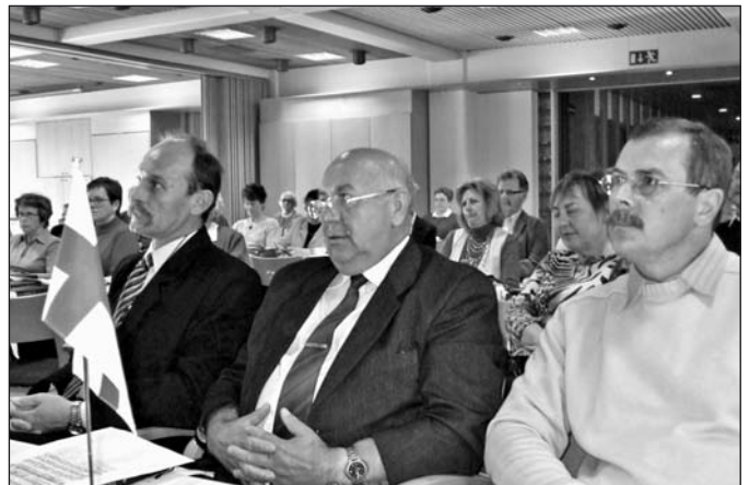
Május 19-26 között tettünk látogatást rovaniemi testvérgyülekezetünknel.