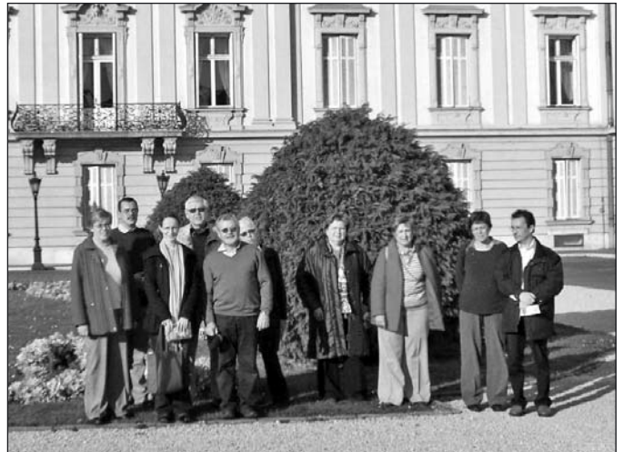
A bajor testvérgyülekezet látogatott el hozzánk november 1-5 között.

Istentisztelet keretében tartottunk előadást Luther: Erős vár című koráljának keletkezéséről.