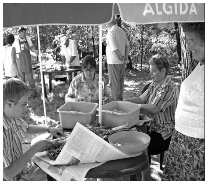
A balatonalmádi gyülekezeti napon a fiatalok is besegítettek az ebéd előkészítésébe.