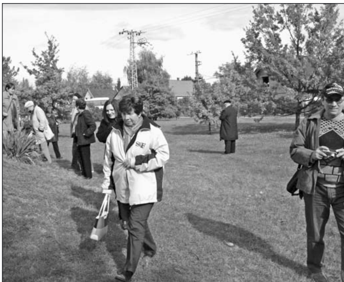
Október 5-én gyülekezeti kirándulást szerveztünk Szarvasra, ahol látogatást tettünk a híres arborétumban is.