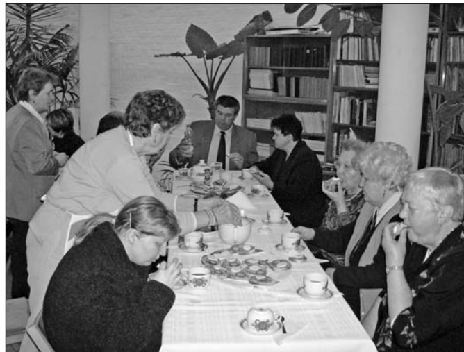
Március 23-án Húsvét hajnali istentiszteletet és szeretetvendégséget tartottunk.